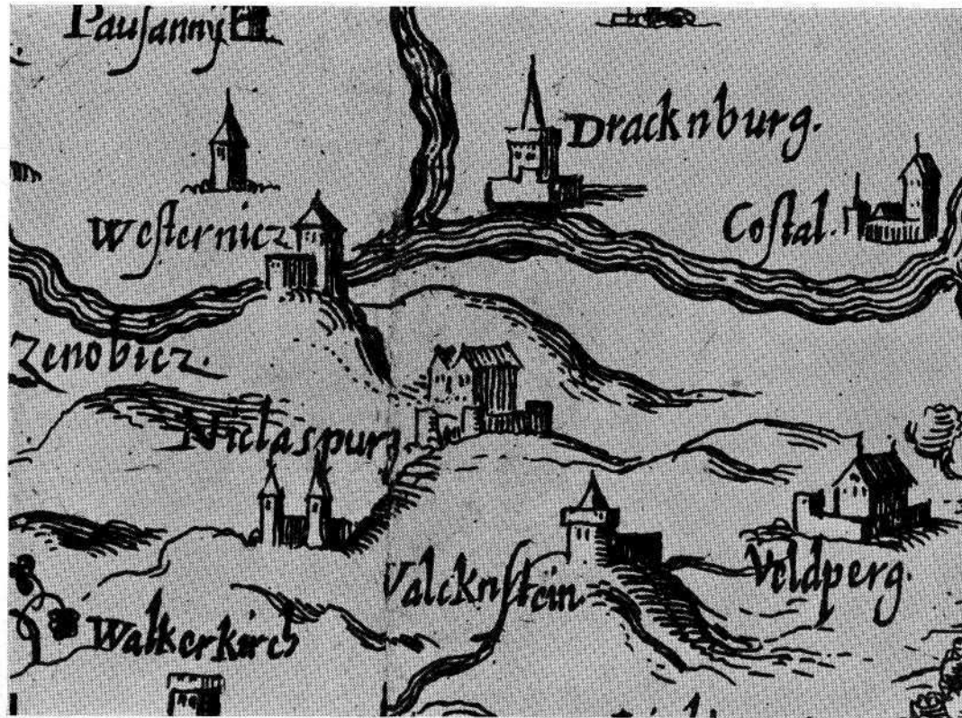
Abb. 3 Österreichkarte von Wolfgang Lazius (Ausschnitt). (Aus dem Germanischen Nationalmuseum Nürnberg)